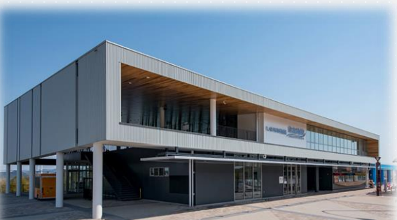
施設(来島海峡サービスエリア)の外観